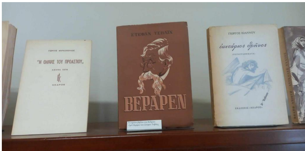
Η πρώτη έκδοση του Κέδρου, 1955.

την εκδοτική δραστηριότητα από τα πρώτα χρόνια της λειτουργίας του ως σήμερα, ένα πολύ ενδιαφέρον υλικό και χρήσιμο εργαλείο της βιβλιογραφικής ιστορίας. Πλούσιο διαφημιστικό υλικό καθώς και κριτικές για τις εκδόσεις του Κέδρου εντοπίζονται στα λογοτεχνικά περιοδικά της συλλογής μας.