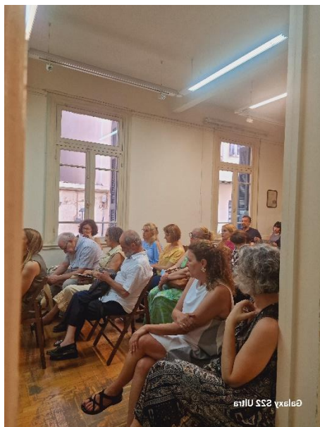
Galaxy S22 Ultra