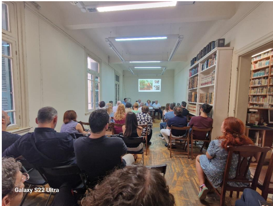
Galaxy S22 Ultra