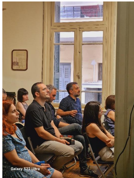
Galaxy S22 Ultra